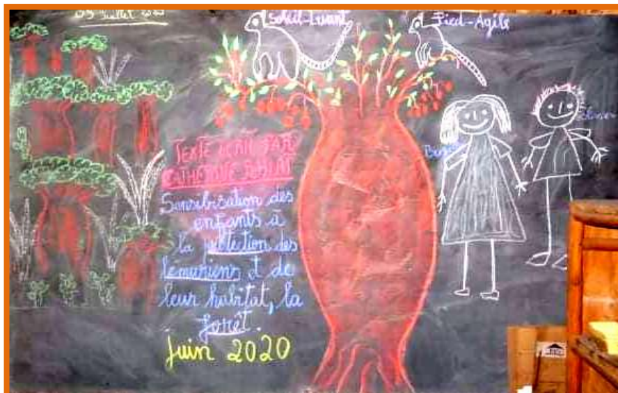
Dessin Ecole La Marmaille