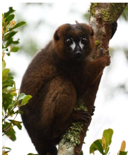
lémur à ventre roux