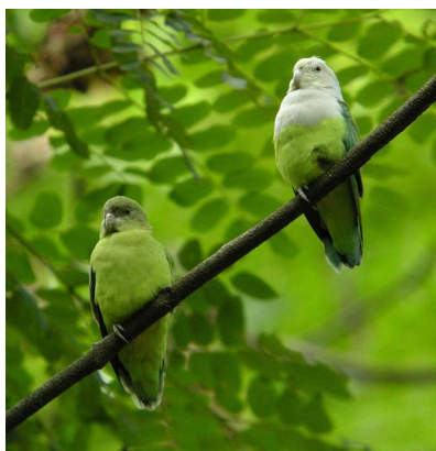
inséparable à tête grise